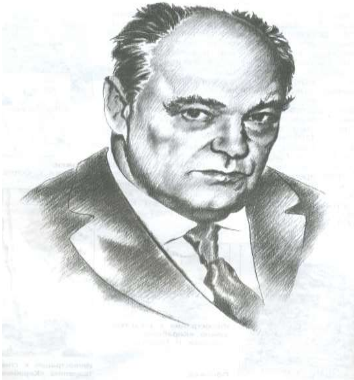
Чарушин Евгений Иванович 1901-1965

Евгений Иванович Чарушин - один из самых любимых детьми художников мира животных. У него особенная техника рисования животных и птиц.